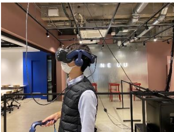
XR 作品の体験イメージ

https://www.odakyu.jp/news/d9gsqg0000001j3v-att/d9gsqg0000001j42.pdf