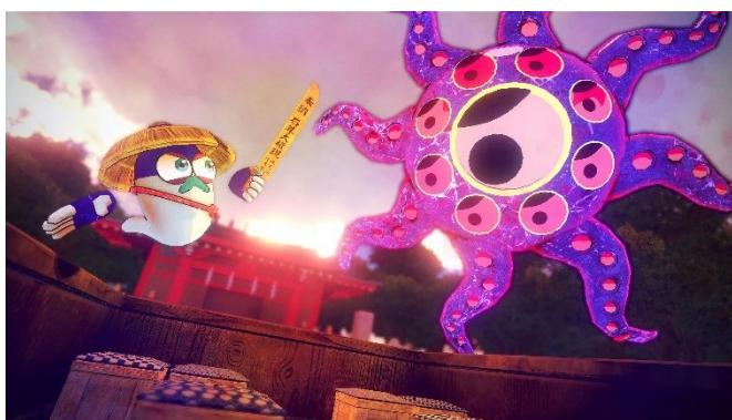
VRゴーグル内での体験イメージ

また、XR体験後には「大山詣り」への理解をもっと深めていただけるよう、伊勢原市と伊勢原市観光協会の協力のもと、ロマンスカーの車内にてガイドブック等を配布します。本企画は、伊勢原駅に到着して終了となり、その後は個人で現地観光をお楽しみいただけます。