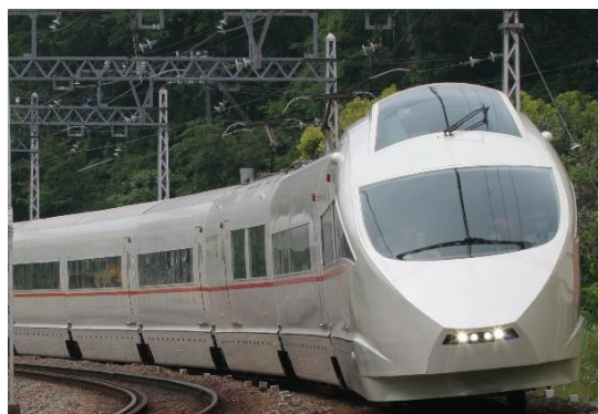
特急ロマンスカー・VSE（50000形）

当社では、2022年11月に、新宿駅西口から徒歩1分程の場所へ、世界最先端のXR技術の体験や、これからのXR技術をリードしていくクリエイターが交流し新たな表現を創作する空間として、日本初のXR特化型複合施設「NEUU」を開業しました。移動そのものの楽しみ方や移動の目的となるリアルな場でしか味わえない価値を高めるテクノロジーとして、XR技術を活用しこれまでにない新しい体験を生み出していきます。